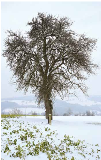
Wuchs: stark; Krone auf Sämling kugelig, später hochkugelig

Erst in der Zwischenkriegszeit begann die „Gute Graue“ an Bedeutung zu verlieren und verschwand ab 1970 fast gänzlich aus den Katalogen der österreichischen Baumschulen. Der Grund lag wohl in der schwindenden Nachfrage nach Obstbäumen und der damit verbundenen Verringerung des Sortenangebots seitens der Baumschulen. Die Kleinfrüchtigkeit und kurze Lagerfähigkeit dürfte ein weiterer Grund dafür sein, dass diese Sorte mittlerweile schon recht selten in den Haus- und Streuobstgärten anzutreffen ist.