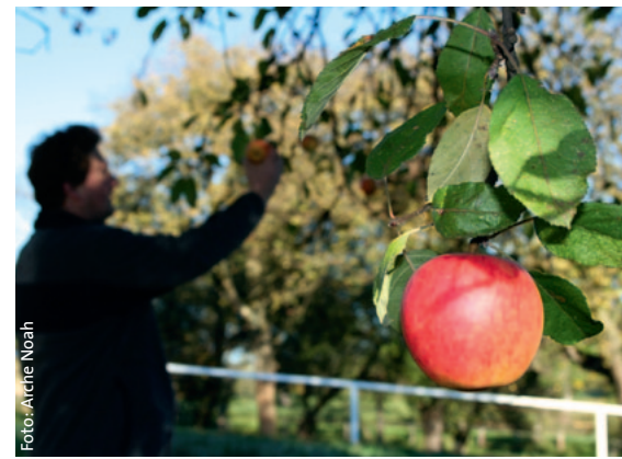
Abb. 4: Will ein Privatmann, der als Eigentümer eines Obstbaums als „Erzeuger“ dieser Pflanze gilt, einen Reiser an eine Baumschule abgeben, müsste er sich gemäß § 14 PflanzenschutzG beim Landeshauptmann als Betrieb registrieren, einen Pflanzenpass führen und eine Latte an Überwachungs- und Aufzeichnungspflichten erfüllen

Zusammengefasst stellt sich daher folgendes Szenario dar: die Analysemethoden und die Diagnostik von Pflanzenschädlingen werden immer präziser und kostengünstiger. Viele Schadorganismen werden schlichtweg leichter gefunden als bis vor wenigen Jahren. Während die Behörden in der Analytik aufrüsten, um die Anforderungen zu erfüllen, bleiben kleine und mittlere Baumschulen, deren Kunden und die Obstvielfalt als Verlierer auf der