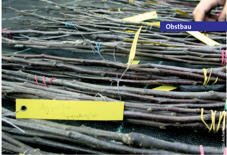
Abb. 2: Genbanken wurden zur Bewahrung und Verfügbarmachung von Obstsorten eingerichtet. Zu diesem Zweck muss auch die Abgabe von Vermehrungsmaterial an Betriebe und Private gewährleistet sein

lich eingestuft, die in anderen Bundesländern und auch in Deutschland als weniger gefährlich erachtet werden. Ist also eine allzu restriktive Pflanzenschutz(gesetzgebungs)praxis schuld an Versorgungsschwierigkeiten bei österreichischen Baumschulen? 1