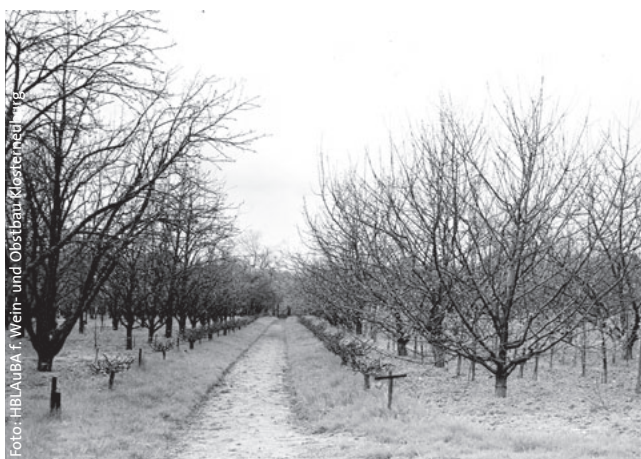
Abb. 3: Das Führen einer Schnittanlage für Reisermaterial für Obst war auch 1930 an der damaligen Höheren Bundeslehranstalt und Bundesversuchsstation für Wein-, Obst- und Gartenbau ein Service für die Praxis

Die NÖ Pflanzenschutzverordnung §35 bietet eine Erleichterung für wissenschaftliche Zwecke, Züchtungsvorhaben, die Vermehrung gebietsweiser oder örtlich verbreiteter Sorten oder in Einzelfällen für bestimmte Arten an. Aber selbst wenn man sich einen Ausnahmebescheid der NÖ Landesregierung in Absprache mit der NÖ Landeslandwirtschaftskammer von dem „Frei von...“-Erfordernis besorgen kann, ist damit noch keine Abhilfe für einen praxisnahen Umgang mit dem Bezug von Edelreisern seltener Sorten in Baumschulen geschaffen. Warum, liegt auf der Hand – kleinräumig und bürokratisch aufwändig, den Pflanzenschutzstandard zu lockern und andernorts streng zu exekutieren, entbehrt jeder ernstgemeinten mit Biodiversitätsförderung in Einklang stehender gesetzlicher Grundlage und ist zudem mit einem enormen administrativen Aufwand verbunden.