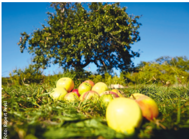
Abb. 5: Es gibt zahlreiche Obstsorten, die nur noch ausschließlich in privaten Beständen vorhanden sind. Es gibt aber keinen gesetzeskonformen Weg, diese Sorten via Baumschulen verfügbar zu machen, da es nicht möglich ist, diese privaten Bestände in die Kontrollverfahren der Baumschulen zu integrieren